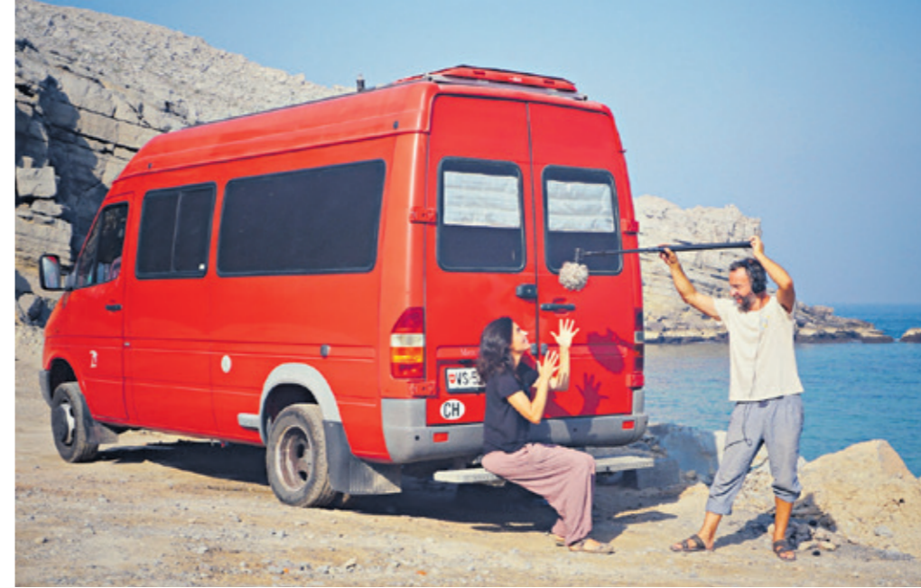
Les paysages qu'ils admirent en route (ici, Musandam) inspirent les deux podcasteurs en van.

→ travail, le résultat convaincant. On n'a qu'une envie à l'issue de l'écoute: partir à Istanbul pour admirer les stands multicolores de Turşu et en boire le jus, appelé Turşusu . Les boissons salées y sont en effet très populaires. L'Ayran est la plus connue: elle se compose de yogourt nature, d'eau et de sel.